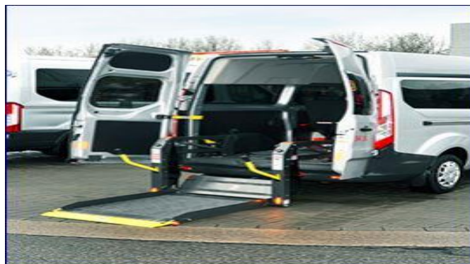
Aangepast vervoer Movi+