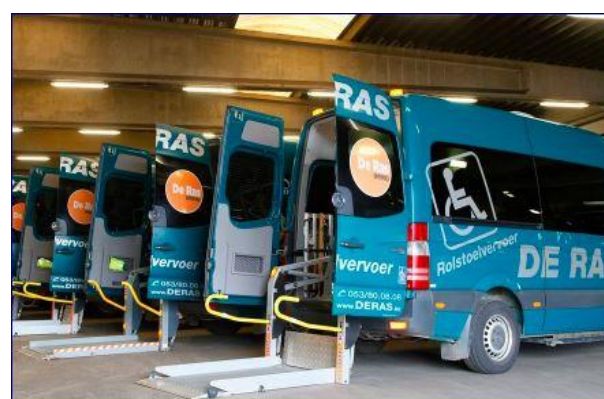
Aangepast vervoer De Ras