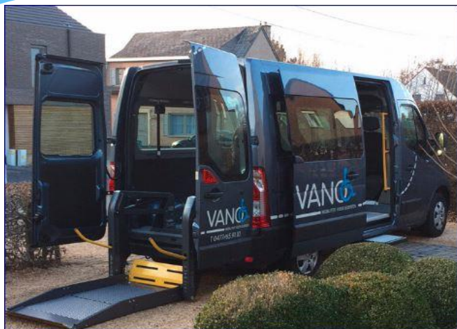
Aangepast vervoer VANO