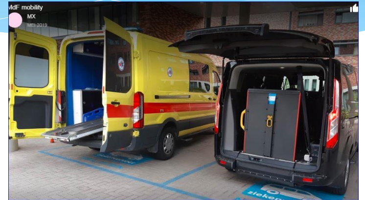
Aangepast vervoer MDF Mobility