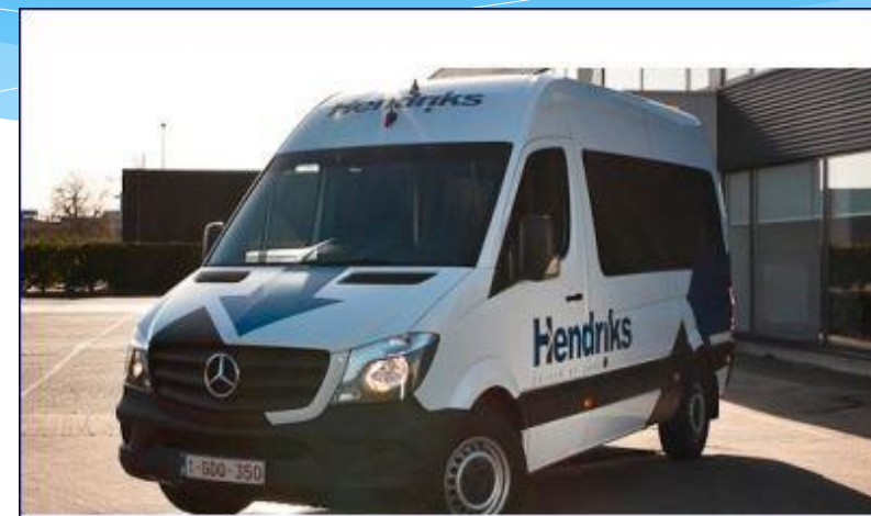
Aangepast vervoer Hendriks