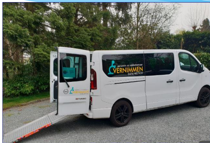
Aangepast vervoer Vernimmen