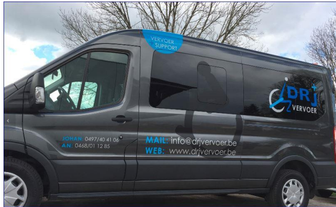
Aangepast vervoer DRJ vervoer