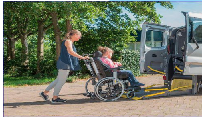
Aangepast vervoer Ken-Tax